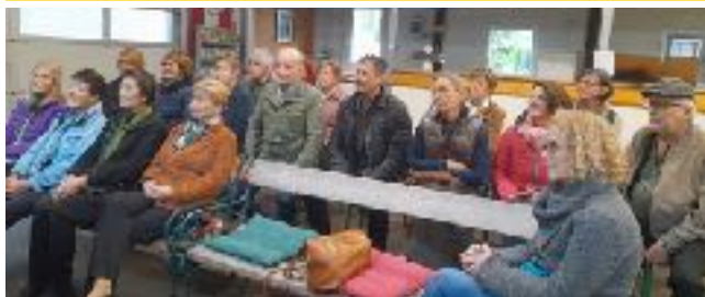
Begegnung Pfarre Pusterwald mit Pfarre Fohnsdorf