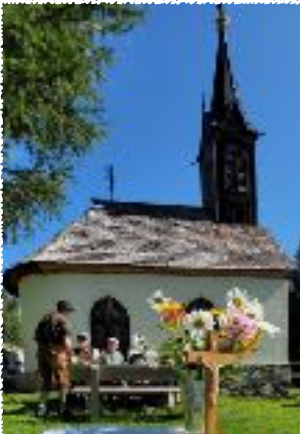
Annasonntag bei der Schneebergerkapelle