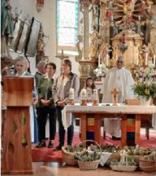
Kräuterbüschelweihe 17. August