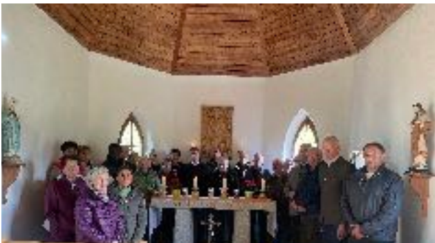
Wendelinmesse 20. Oktober

Alle ausführlichen Berichte können Sie gerne auf der Homepage nachlesen.