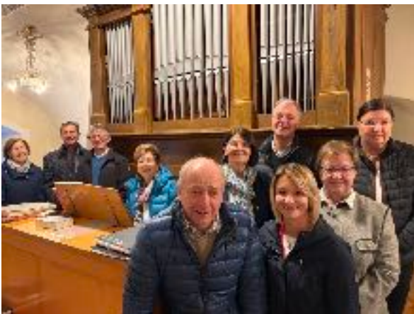
Jubelpaarmesse umrahmt von der Chorgemeinschaft 5. Oktober